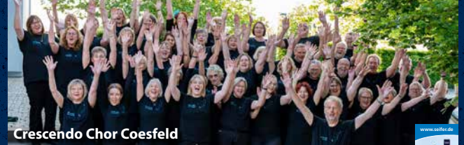
Crescendo Chor Coesfeld

Erleben Sie vielseitigen modernen Pop und kraftvolle Gospelsongs zum Start in die lange Nacht der Livemusik.