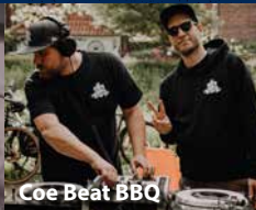
Coe Beat BBQ