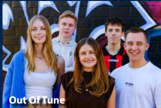
Out Of Tune

unterstützt durch: Bürgerstiftung Coesfeld